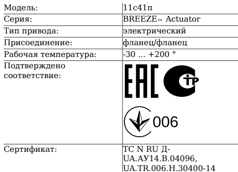
Таблица 1. Характеристики