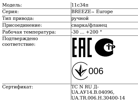
Таблица 1. Характеристики